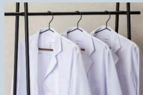
S~3LLでジャストでの 着こなしが可能