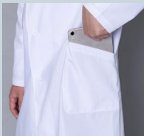
斜めに配置した サイドポケットは ミニサイズタブレット 対応サイズ