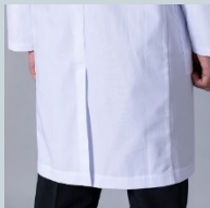
センターベント仕様で 足捌きもスムーズに